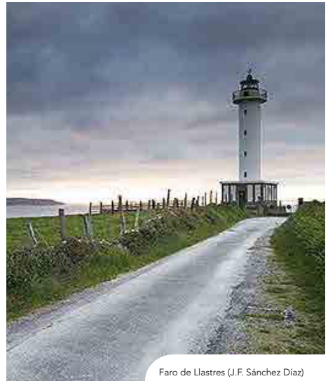
Faro de Llastres (J.F. Sánchez Díaz)