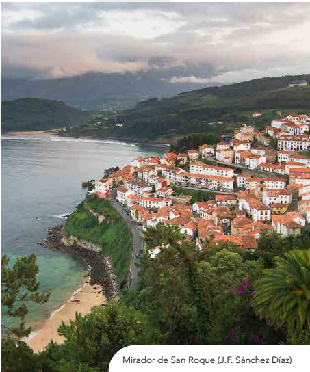
Mirador de San Roque (J.F. Sánchez Díaz)

cilíndrica emite destellos equidistantes cada 12 segundos, con un alcance medio de 23 millas. Desde el faro hacia poniente se domina una excelente vista de los acantilados que se extienden desde la playa de Rodiles hasta la Punta de Tazones, cuyo faro se domina a simple vista. Hacia el Este la vista alcanza hasta Punta Misiera, que esconde la villa de Llastres.